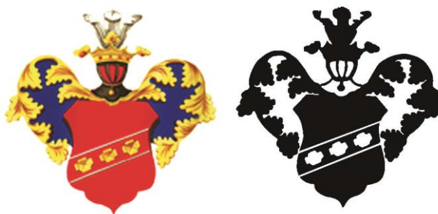
Образец элемента для тиснения (до трассировки и после)